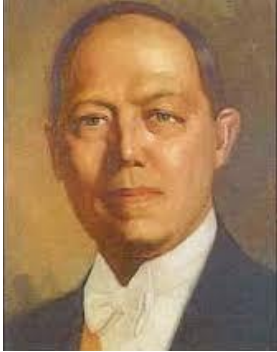
Enrique Olaya Herrera