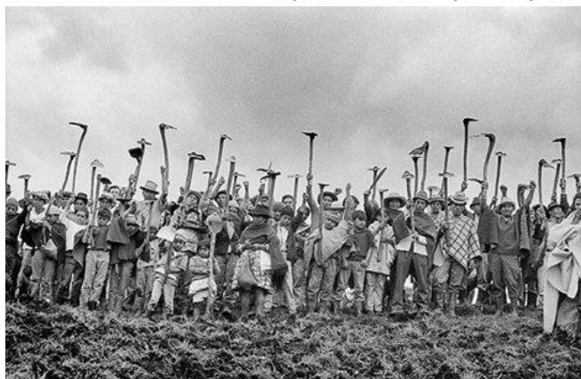
Reforma Agraria de 1936 en la administración de López Pumarejo

La Reforma Constitucional fue aprobada en 1936 por el Congreso y determinó aspectos fundamentales. En términos generales, propuso que los cambios debían responder a las necesidades del país y debía ser acordes con la realidad las personas en aquella época.