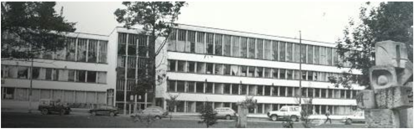
Universidad Nacional de Colombia