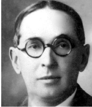
Alfonso López Pumarejo