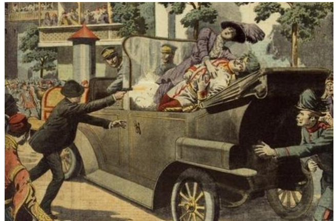
Dibujo que representa el asesinato del heredero del Imperio de Austria-Hungría, el archiduque Francisco Fernando, y de su mujer.

crisis se produjo cuando cada uno de los tres países tomó partido, unos por Austria y otros por Serbia.